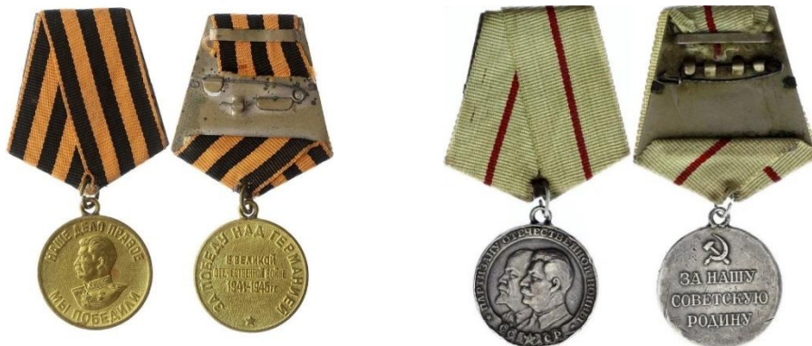
Медаль «За победу над Германией в Великой Отечественной войне 1941 – 1945 гг.»