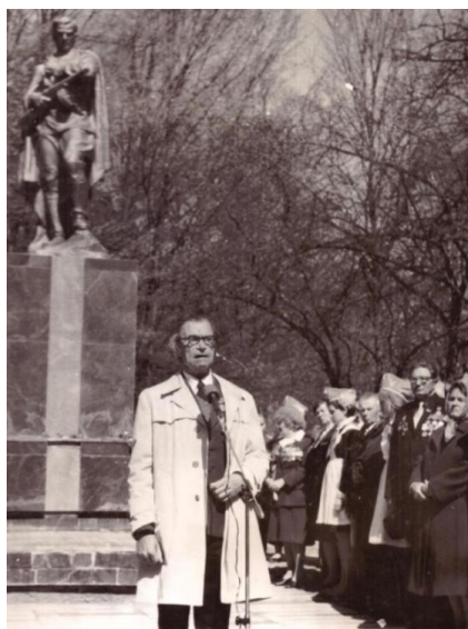
Выступ на адной з урачыстацей