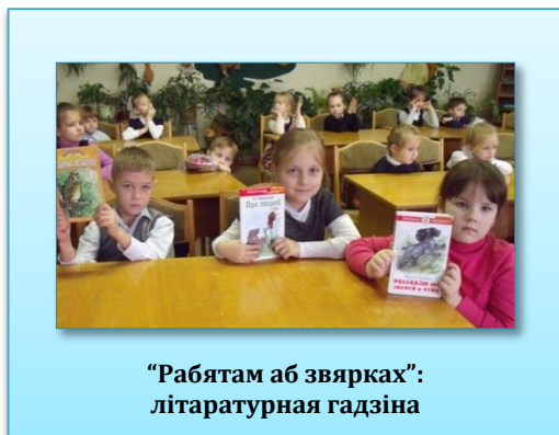
“Рабятам аб звярках”: літаратурная гадзіна

У 2012 годзе адно з пасяджэнняў клуба было прысвечана гумарыстычным творам. На мерапрыемстве дзеці пазнаёміліся з творчасцю Карнея Чукоўскага і Самуіла Маршака. Таксама даведаліся пра значэнне слова “гумар”, вызначылі, што робіць смешнымі герояў іх вершаў і казак. Пасля ім была прапанавана літаратурная віктарына з гумарыстычнымі пытаннямі.