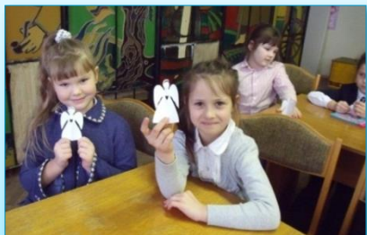
“Новы год – час чараўніцтва”: творчая майстэрня

Апошняя пасяджэнне клуба “Новы год – час чараўніцтва” ў