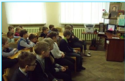
Літаратурная гадзіна да 185-годдзя “Казкі пра папа і яго работніка Балду” А.С. Пушкіна

У 2015 годзе літаратурная гадзіна ў клубе была прысвечана 185-годдзю з часу напісання твора Аляксандра