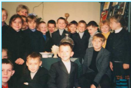
Першыя ўдзельнікі клуба “Чытайка”

Дзіцячы літаратурны клуб “Чытайка” быў створаны ў 2007