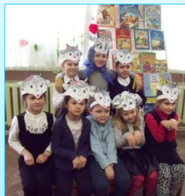
“Воўк і сямёра казлянят”: тэатралізаванае прадстаўленне

Напярэдадні вясновых канікулаў “чытайкі” гаварылі пра тых, хто з казачных герояў парушыў наказ, які ім давала мама, і што з гэтага атрымалася. Дзеці ўспомнілі казкі розных народаў свету, абмеркавалі канкрэтныя казачныя сітуацыі, у якія трапілі непаслухмяныя і даверлівыя героі твораў. А потым яны бралі ўдзел у тэатралізаваным