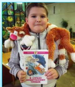
Юбілей Л. Гераскінай

А ў лістападзе ўрачыста і весела адзначылі 105-годдзе з дня нараджэння Ліі Гераскінай, аўтара адной з самых вядомых дзіцячых кніг “У краіне нявывучаных урокаў”. Хлопчыкі і дзяўчынкі чыталі твор дома. Ім вельмі спадабаліся пацешныя вершы, незвычайныя прыгоды хлопчыка Віці Перастукіна і яго ката Кузі. Дзеці даведаліся пра памылкі, якія Віктар паспеў зрабіць у школе, навучыліся рашаць задачы, успомнілі правілы граматыкі і