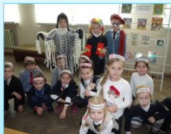
“Муха-Цакатуха”: тэатралізаванае прадстаўленне

У наступны раз “чытайкі” пазнаёміліся з жыццём і творчай дзейнасцю Карнея Чукоўскага і сталі сапраўднымі акцёрамі тэатралізаванага прадстаўлення па