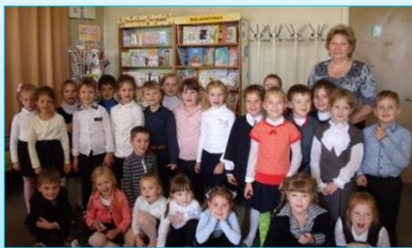
“Чытайка” – гэта МЫ!

У 2016 годзе ў клубе “Чытайка” з’явіліся новыя ўдзельнікі – вучні 1 “А” класа ДУА “Сярэдняя школа № 7”. 15 верасня, у Дзень