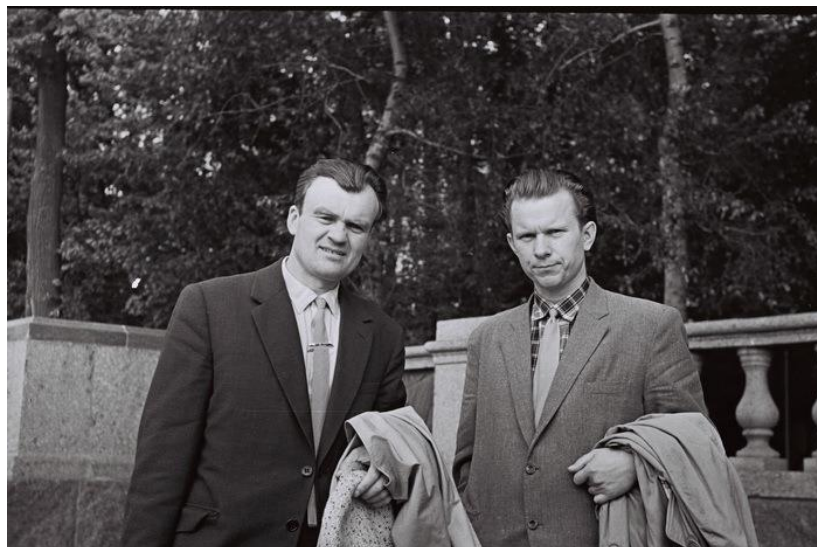
Аляксей Карпюк і Васіль Быкаў. Мінск, 30.05.1960.

У 1961 годзе скончыў Вышэйшыя літаратурныя курсы ў Маскве. З 1961 года загадчык агенцтва «Інтурыст» (Гродна). У 1965–1972 гадах – сакратар Гродзенскага абласнога аддзялення Саюза пісьменнікаў БССР, з 1970 года – упаўнаважаны Ўсесаюзнага агенства па аўтарскіх правах па Гродзенскай і Брэсцкай вобласці, у 1977–1981 гадах – дырэктар Рэспубліканскага музея атэізму і гісторыі рэлігіі ў Гродна. У 1978 – 1992 гадах зноў сакратар Гродзенскага аддзялення Саюза пісьменнікаў БССР. У другой палове 1980-х гадоў актыўна ўдзельнічае ў грамадскім жыцці Гродна, адзін з актывістаў Беларускага народнага фронту, адзін з заснавальнікаў аб’яднання беларусаў свету «Бацькаўшчыны», быў членам клуба «Паходня».