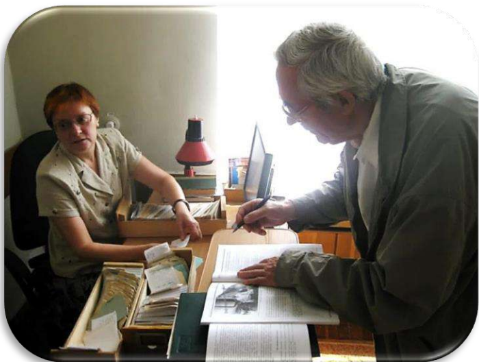
Пошукавая і даследчая праца Ф. Ігнатовіча ў Гродзенскай абласной бібліятэцы імя Я.Карскага. Аўтар, час здымку невядомы.