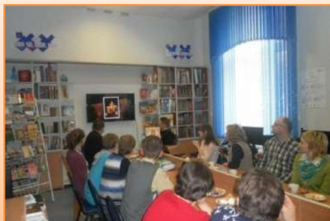
«Святой Владимир»: кинолекторий

В 2016 году в клубе «Денница» организовали литературный час «Духовных книг божественная мудрость» . Речь шла о книгах, рекомендованных для чтения во время поста. С интересом рассматривали как древние, так и современные издания духовной литературы, Жития Святых и подвижников. Каждый из участников рассказал о любимых книгах, которые оставили неизгладимое впечатление и изменили жизнь.