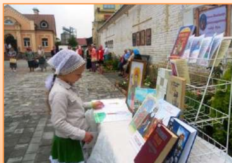
«Князь Владимир. Цивилизационный выбор Руси»: выставка

В 2016 году участники клуба «Денница» собрались в Воскресной школе при Свято-Владимирской церкви на литературно-музыкальный вечер «Святой Равноапостольный князь Владимир – креститель Руси» . Библиотекари рассказали об одном из важнейших культурных событий в истории Древней Руси – Крещении. На вечере звучали музыка и песни, а викторина стала проверкой знаний о судьбоносном событии.