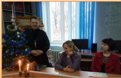
«Чудесные мгновения Рождества»: вечер