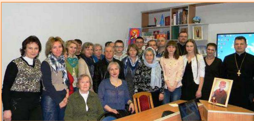
Участники клуба «Денница»

Во время заседаний члены клуба знакомятся с традициями православной культуры, историей религиозных праздников, духовной литературой из фонда библиотеки.