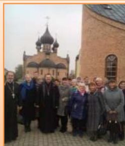
Путешествие к святыням Киевской Руси