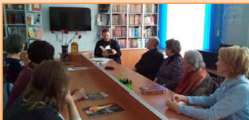
«Пасхальные корзинки: делаем своими руками»: мастер-класс

В начале июля в библиотеке устраивают литературно-музыкальные вечера, посвящённые Дню семьи, любви и верности . В программе: знакомство с историей праздника, его символом – ромашкой, игры и обмен открытками с добрыми пожеланиями. Так прошли мероприятия «На любовь своё сердце настрою» (2015) и «Семейная ромашка» (2016) (Приложение № 1). В 2017 году состоялась литературно-музыкальная гостиная «Ромашковое счастье» . Был представлен документальный фильм о Петре и Февронии, чей союз стал образцом христианского брака. Во время конкурсов участники отвечали на вопросы о семейных ценностях, на лепестках ромашки писали рецепты счастья, любви и верности, познакомились с изданиями, представленными на выставке «Семья как символ вечных ценностей».