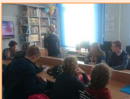
День православной книги