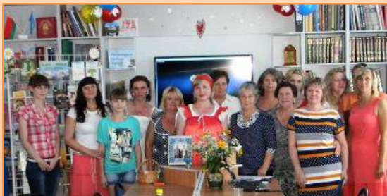
День семьи, любви и верности