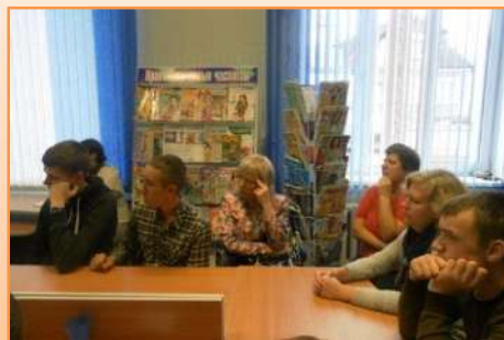
Виртуальное путешествие в Израиль