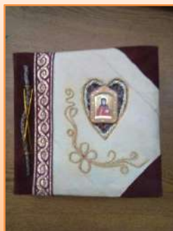
Самодельная книга к 500-летию белорусского книгопечатания

Тарасова О.Н. является автором духовных рассказов «Подарок», «Зов судьбы», «Вот такая арифметика!», «Точно знаю, что чудеса бывают», «Святая Земля: прикосновение к вере», «Духовные тропы Святой Руси», с которыми читатели знакомятся во время библиотечных мероприятий.