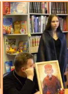
День памяти равноапостольного князя Владимира