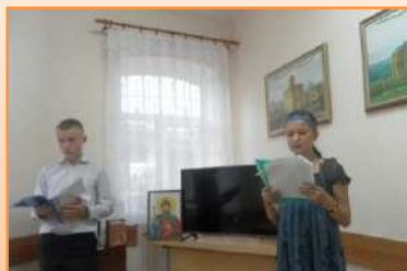
«Святой Равноапостольный князь Владимир – креститель Руси»: литературно-музыкальный вечер