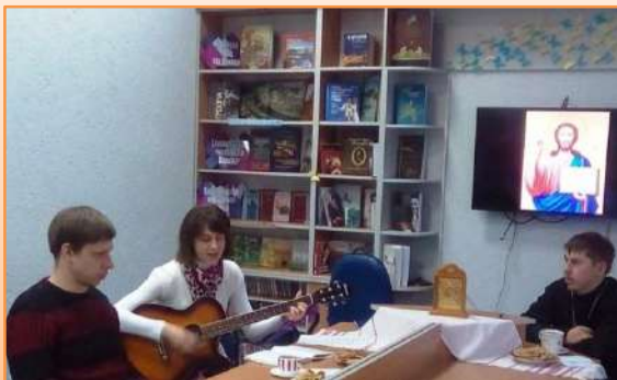
«Масленица литературная»: праздник

Традиционно 14 марта участники клуба «Денница» собираются вместе, чтобы отметить День православной книги , приуроченный к дате выпуска первой печатной книги на Руси «Апостол» И. Фёдорова.