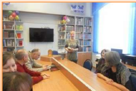
«Духовных книг божественная мудрость»: литературный час