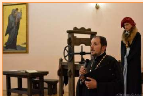
«История белорусской книжности»: вечер

В 2016 году на одном из заседаний совершили виртуальное путешествие на Святую Землю – в Израиль – к достопримечательностям и архитектурным памятникам, упомянутым в Библии.