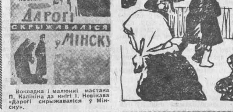
Вокладка і малюнкi мастака П. Калініна да кнігі І. Новікава «Дарогі скрыжаваліся ў Мінску».

Прапануем чытаць старонкі з некаторых кніг, што неўзабаве выйдучы ў выдавецтва «Беларусь».