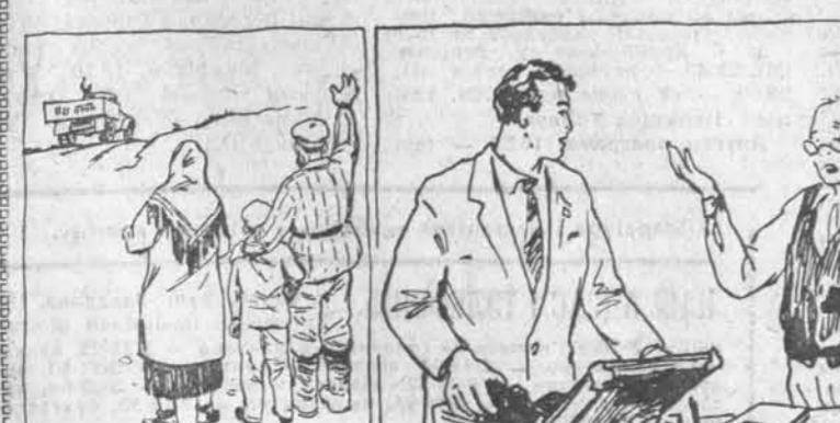
Малюнкi мастака В. Ягорава да кнігі М. Пяслявіча «Зялёны канверт».