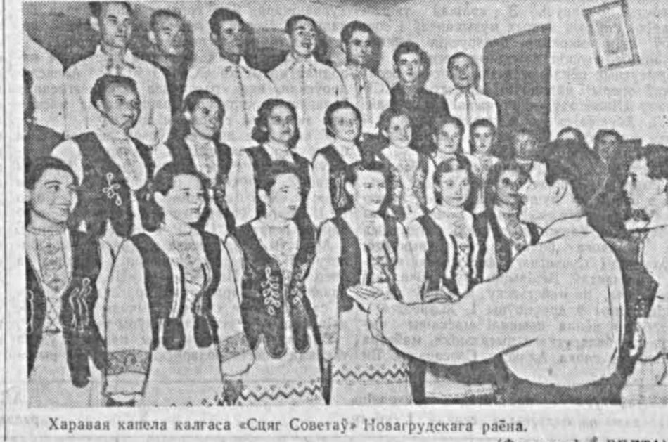
Харавая капела калгаса «Сцяг Совету» Новагрудскага раёна.

У ВАУКАВЫСКІМ раёне ёсць вёска Дубаўцы. За вёскай ля дарогі ляжыць вялікая вадзіна. Гісторыя іх така. Калісьці на гэтым месцы сустрэліся два вяшчцы. Адзін малады хлопец і адзін малады мёртвы, а за ім і другі. Пятер на гэтым месцы ляжаць два валуны. Ёсць такія карэспандэнты, якія, прыехаўшы ў Гродна, патрабуюць паказаць і старасветчыну і «самабытнасць». Даўна былое слухаць тэма таварышы. Даўна былое, што рамантычныя старасветчыны.